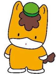
群馬県のマスコット 「ぐんまちゃん」